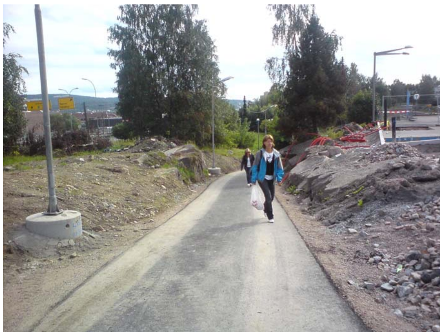
Illustrasjon III: Dagens situasjon på østsida av plattformen.