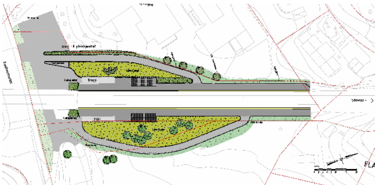
Illustrasjon II: Plan ny utforming