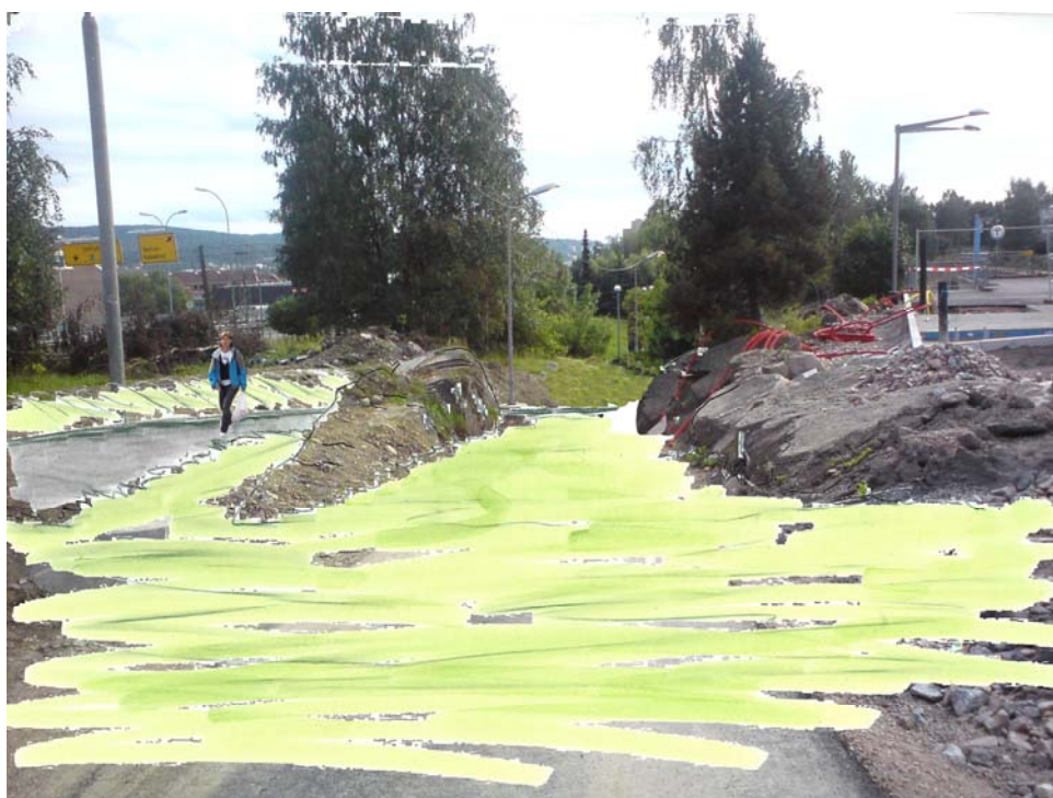
Illustrasjon IV: Ny rampe planlegges i en større bue øst for dagens trasé, slik at universell utforming oppnås (stigning 1:20). Noe av traséen blir liggende i skjæring, og knauser tas vare på der det er hensiktsmessig. Dagens asfalt fjernes og området tilsåes.