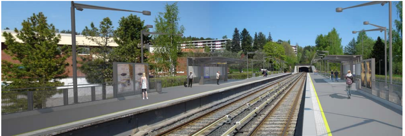
Illustrasjon I: Kalbakken etter oppgradering

Følgende illustrasjoner, som ikke er gjenstand for vedtak og derfor ikke juridisk bindende, viser en mulig maksimal utbygging iht. forslaget.